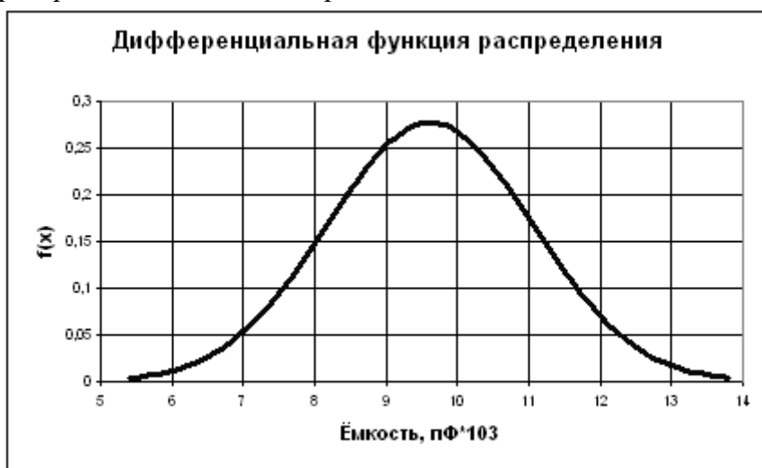
Рис. 1.3. Дифференциальная функция распределения ёмкости пластин пьезоэлементов Задание.