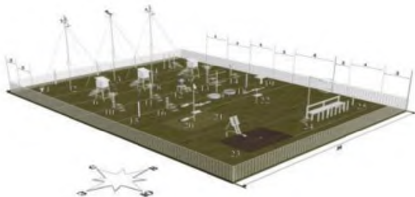
Рис. 1. Схема размещения нового оборудования на метеоплощадке с полной программой наблюдений:

Оба комплекса (АМК, ААК) связаны друг с другом линией связи, состоящей из двух свитых проводов. Такая система обеспечена надежными современными средствами двусторонней связи с центром сбора данных (ЦСД). Для организации внешней связи используются как проводные (телеграфные, телефонные) так и беспроводные каналы (КВ, УКВ приемопередатчики, сотовые, спутниковые), входящие в состав подсистем низовой связи (ПНС). Выбор вида связи для конкретной системы обусловлен прежде всего степенью обеспеченности региона, в котором она находится, средствами связи и качеством их функционирования.