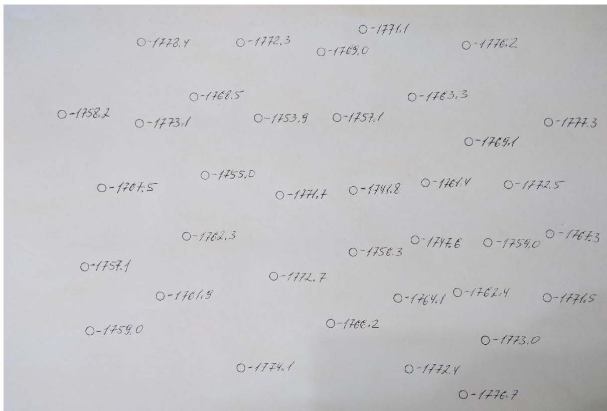
Рисунок. Абсолютные отметки поверхности