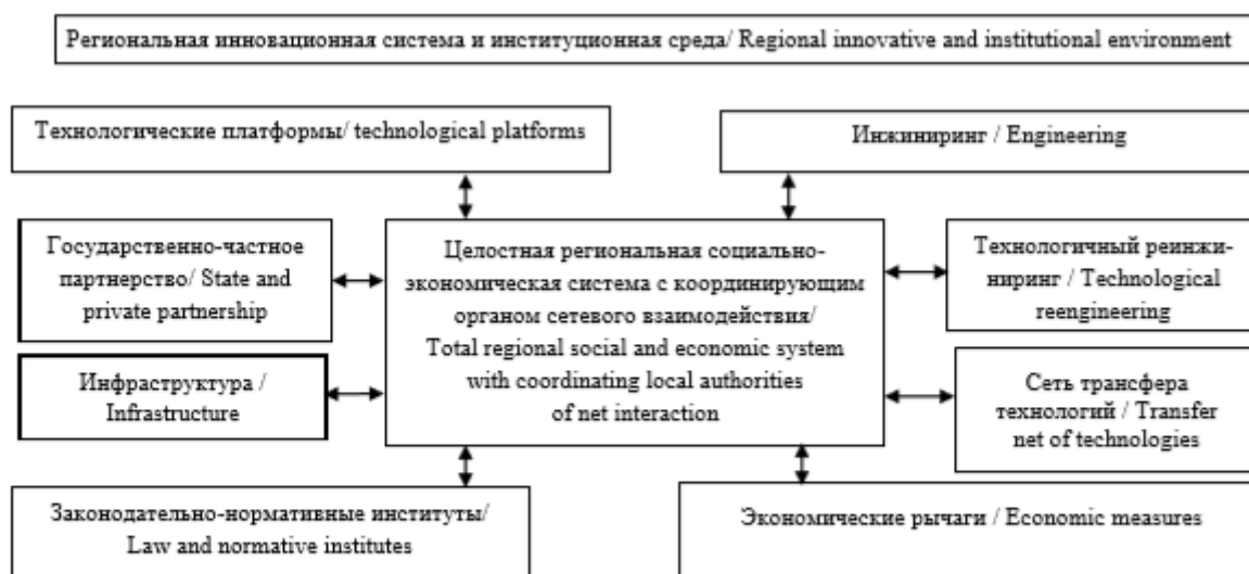
Рис. 2. Региональная инновационная система и институциональная среда

Объяснить причинно-следственные связи формирования Региональной инновационной системы и институциональной среды (рис.2).