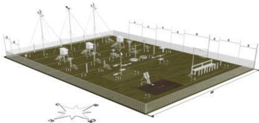
Рис. 1. Схема размещения нового оборудования на метеоплощадке с полной программой наблюдений:

Оба комплекса (АМК, ААК) связаны друг с другом линией связи, состоящей из двух свитых проводов. Такая система обеспечена надежными современными средствами двусторонней связи с центром сбора данных (ЦСД). Для организации внешней связи используются как проводные (телеграфные, телефонные) так и беспроводные каналы (КВ, УКВ приемопередатчики, сотовые, спутниковые), входящие в состав подсистем низовой связи (ПНС). Выбор вида связи для конкретной системы обусловлен прежде всего степенью обеспеченности региона, в котором она находится, средствами связи и качеством их функционирования.