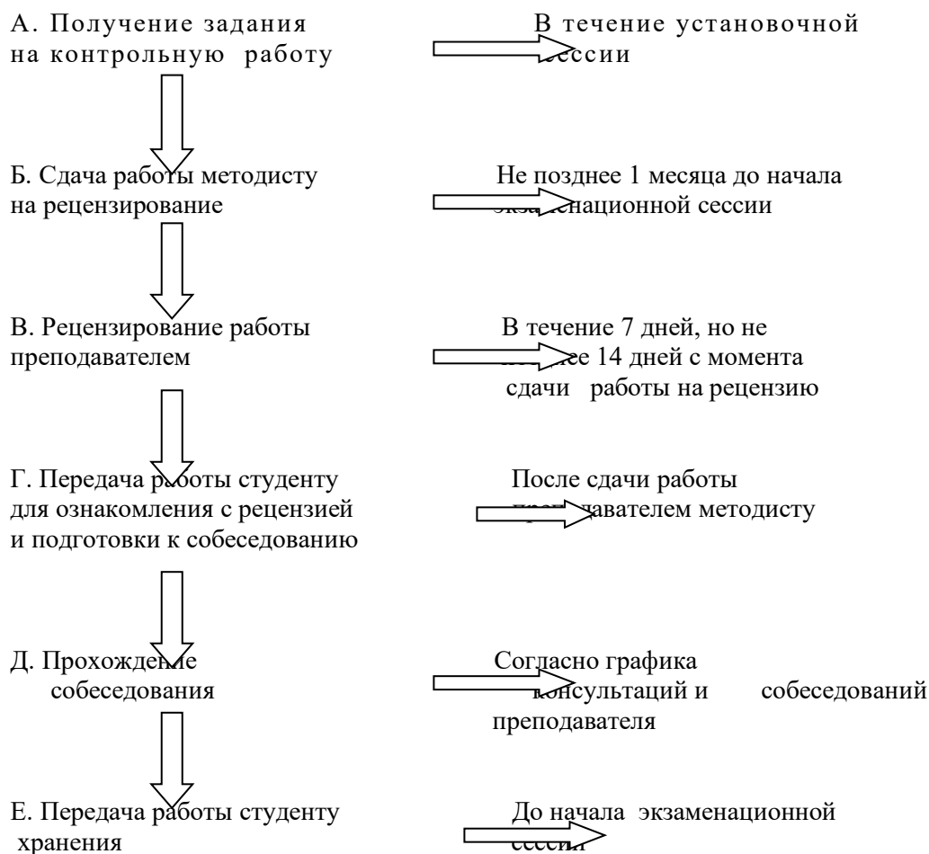
Рис. 1. Блок-схема прохождения контрольных работ