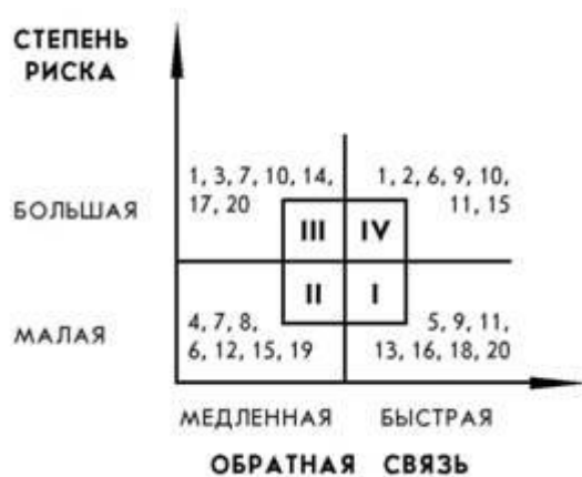
СХЕМА ТИПОВ ПСИХОЛОГИЧЕСКИХ КУЛЬТУР (С НАБОРАМИ КАЧЕСТВ)

приводимая ниже, получена после статистической обработки данных, собранных нами более чем за два года, в течение которых применялась процедура.