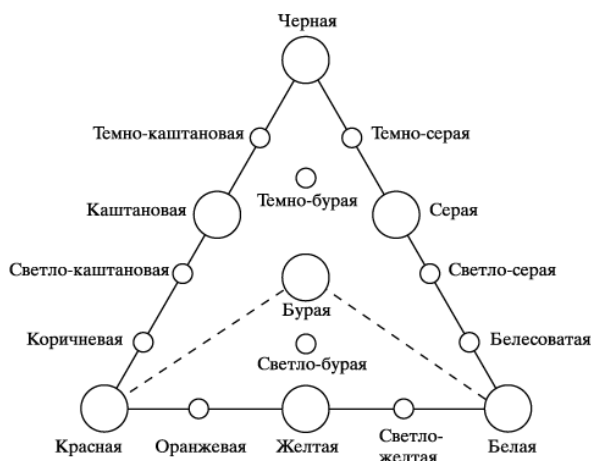
Рис. 1. Треугольник цветов С.А. Захарова

Не следует путать цвет с окраской. Под окраской понимается характер распределения и проявления цвета. Окраска может быть: