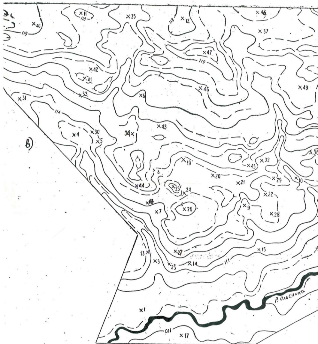
Краткая характеристика местности.

Исходный материал: Фрагмент карты с рельефом в горизонталях (масштаб 1:10000). Сечение рельефа через 1 м, полугоризонтали через 0,5 м.