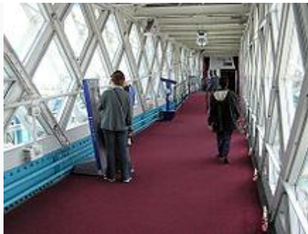
Interior of high-level walkway (used as an exhibition space)

The Tower Bridge Exhibition is a display housed in the bridge's twin towers, the high-level walkways and the Victorian engine rooms. It uses films, photos and interactive displays to explain why and how Tower Bridge was built. Visitors can access the original steam engines that once powered the bridge bascules, housed in a building close to the south end of the bridge.