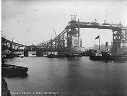
Tower Bridge under construction, 1892