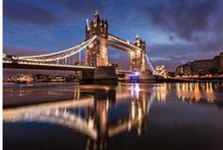
Tower Bridge at dawn

The bridge is 800 feet (240 m) in length with two towers each 213 feet (65 m) high, built on piers. [38] The central span of 200 feet (61 m) between the towers is split into two equal bascules or leaves, which can be raised to an angle of 86 degrees to allow river traffic to pass. The bascules, weighing over 1,000 tons each, are counterbalanced to minimise the force required and allow raising in five minutes.