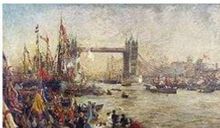
1895 painting of the opening of Tower Bridge, William Lionel Wyllie

Tower Bridge was officially opened on 30 June 1894 by the Prince and Princess of Wales. An Act of parliament stipulated that a tug boat should be on station to assist vessels in danger when crossing the bridge, a requirement that remained in place until the 1960s.