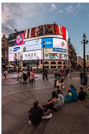
Illuminated signs of Piccadilly Circus at dawn, 2014

Piccadilly Circus was surrounded by illuminated advertising hoardings on buildings, starting in 1908 with a Perrier sign, but only one building now carries them, the one in the northwestern corner between Shaftesbury Avenue and Glasshouse Street. The site is unnamed (usually referred to as