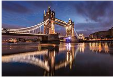
Tower Bridge at dawn

The bridge is 800 feet (240 m) in length with two towers each 213 feet (65 m) high, built on piers. [38] The central span of 200 feet (61 m) between the towers is split into two equal bascules or leaves, which can be raised to an angle of 86 degrees to allow river traffic to pass. The bascules, weighing over 1,000 tons each, are counterbalanced to minimise the force required and allow raising in five minutes.