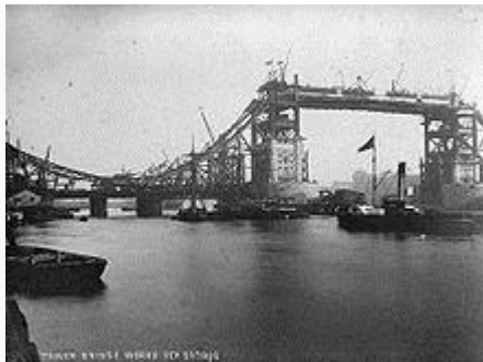
Tower Bridge under construction, 1892