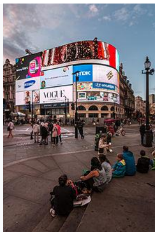
Illuminated signs of Piccadilly Circus at dawn, 2014

Piccadilly Circus was surrounded by illuminated advertising hoardings on buildings, starting in 1908 with a Perrier sign, but only one building now carries them, the one in the northwestern corner between Shaftesbury Avenue and Glasshouse Street. The site is unnamed (usually referred to as "Monico" after the Café Monico, which used to be on the site); its addresses are 44/48 Regent Street, 1/6 Sherwood Street, 17/22 Denman Street and 1/17 Shaftesbury Avenue, and it has been owned by property investor Land Securities Group since the 1970s.